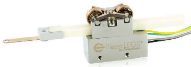
Рис. 3. Внешний вид модели LL10 из немагнитных материалов для эксплуатации в вакууме

жения в прямолинейное, а от пьезодвигателей предыдущего поколения – так называемым «нерезонансным» типом, поскольку теперь положение каждой ноги известно в любой момент времени по приложенному к ней электрическому воздействию, что гарантирует точное управление во всем диапазоне скоростей. Конструкция LL10 (рис. 3) предполагает использование двух прижимных свободно вращающихся подшипников, причем ноги пьезодвигателя находятся в корпусе ниже горизонтального приводного штока.