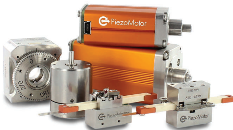
Рис. 1. Продукция компании PiezoMotor

Компания PiezoMotor специализируется на пьезоэлектрических двигателях для специальных областей применения. Например, в 2019 году ожидается запуск студенческого спутника с таким пьезодвигателем на борту, а в 2018 году PiezoMotor предоставила заказанный одной неназванной крупной телекоммуникационной компанией прототип специально разработанного для массового выпуска микромотора. В принципе это характерно и для других изготовителей пьезоэлектрических двигателей. Ведь пьезоприводы проигрывают