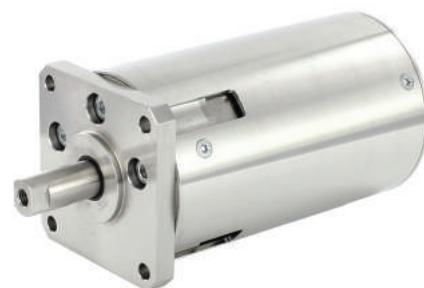
Рис. 4. Наиболее мощный линейный пьезодвигатель серии Piezo LEGS на 450 Н

Выход контроллера/усилителя PMD301 и вход двигателей Piezo LEGS согласованы, причем в терминологии