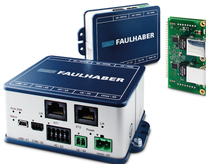
Рис. 1. Контроллеры Motion Controller V3.0 Faulhaber

С помощью тепловых моделей новые контроллеры защищают моторы и электронику от перегрузок. Также отслеживается переход двигателя в генераторный режим, то есть контролируется отдача энергии в сеть. Тем самым обеспечивается защита внешних устройств во время работы системы. Возможно